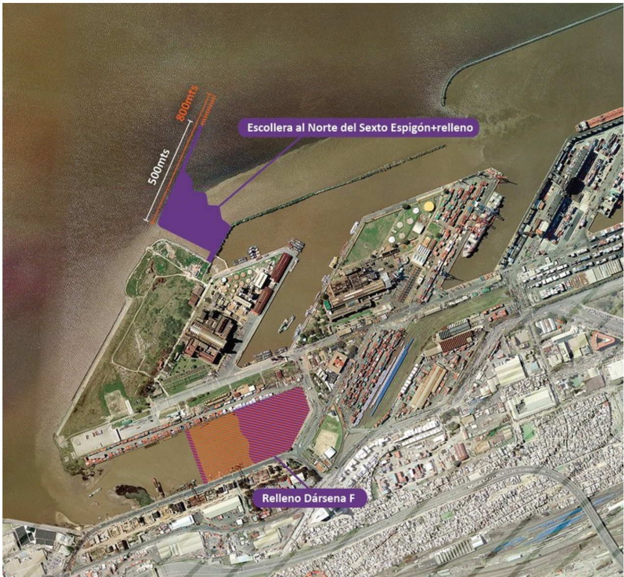
Los dos sectores donde están ampliando el puerto.

Además de mejorar el manejo logístico de los barcos, estas obras también permitirán la construcción de un ingreso único al puerto, desde donde podrán entrar y salir los camiones que, justamente, vengan desde la futura autopista subterránea.